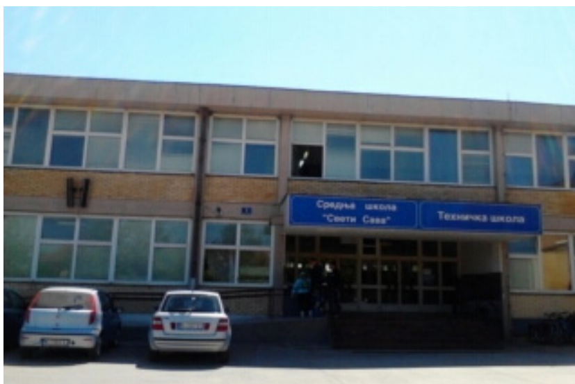
Слика 2. Средње школе „Свети Сава“ и Техничка школа, Кладово (М. Јовановић, мај 2013. год.)

На основу података надлежне Школске Управе (Школска Управа Зајечар) у школску 2012/13. год. на територији Општине Кладово уписано је укупно 1.838 ученика. Школску омладину основношколског узраста чине 1.280 ученика из укупно шест основних школа („Вук Караџић“, „Стефаније Михајловић“, „Љубица Јовановић Радосављевић“, „Хајдук Вељко“, „Светозар Радић“, ОМШ „Константин Бабић“ ) и 558 ученика средњошколског узраста из две средње школе, „Свети Сава“ и „Техничка школа“ (Слика 2).